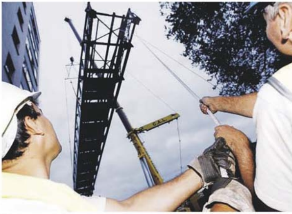
So élevée par une grue géante, la passerelle s'est promenade dans les airs avant d'être déposée sur une longue rampe.

Posé sur l'Ill depuis 1899 (on parle alors de Passerelle-Genève), le pont a été soulevé à son cadre de verdure et déposé sur une longue rampe extensible attachée à son train. L'opération avait été d'abord préparée : on avait préalablement élargué les voies charnières laissées sur les garde-corps en