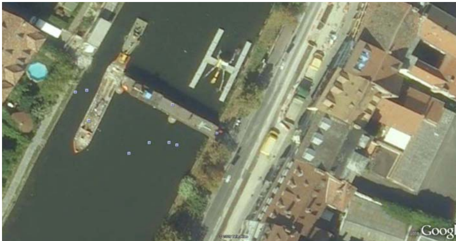
Bauphase im Jahr 2007