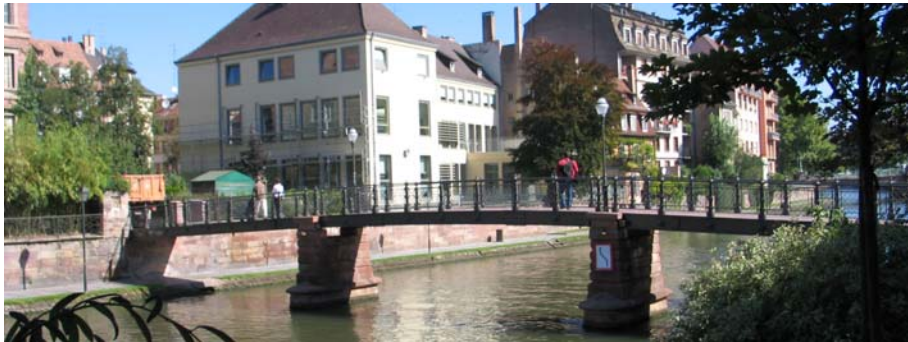
Seitenansicht instandgesetzte Brücke

Die „Passerelle de l'Abreuvoir“ wurde 1892 erstellt und 1919 wiederaufgebaut. Die stark frequentierte Fußgängerbrücke befindet sich in der historischen Altstadt von Straßburg. Die Brücke überspannt als Dreifeldträger die Ill und ist auf zwei Sandsteinpfeilern gelagert. Die beiden seitlichen Hauptträger wurden als INP 450 ausgebildet. Der Überbau besteht aus einer unbewehrten Stampfbetonausfachung die von Rundstahlzuggliedern im Stahlprofil gehalten wird. Das Geländer besteht aus gusseisernen Pfosten und einer geschmiedeten Gitterkonstruktion.