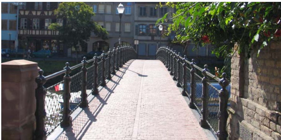
Blick auf Fuß- und Radweg nach erfolgter Instandsetzung

Die Stahlträger befanden sich in schlechtem Zustand, so dass ein Austausch erforderlich wurde. Die neuen Stahlträger wurden auf Neoprenlagern aufgelegt. Die Lagersteine aus Sandstein waren gerissen und wurden ersetzt, die Sandsteinpfeiler blieben erhalten. Die Betonausfachung wurde durch gevoutete Stahlbetonfertigteile hergestellt. Der Belag der Brücke wurde mit Natursteinpflasterung ausgeführt. Eine planmäßige Entwässerung wurde eingebaut. Der Korrosionsschutz wurde durch Verzinkung und Schutzanstriche sichergestellt. Die Sanierung sah vor, die Geländerpfosten aus Gusseisen zu erhöhen, um die Sicherheit für Radfahrer zu erhöhen. Dies wurde durch Unterfütterung der bestehenden Geländerpfosten mit neu hergestellten Sockeln aus Gusseisen erreicht. Ansonsten wurde der ursprüngliche Zustand der Brücke wieder hergestellt.