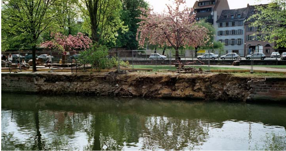
Ansicht der eingestürzten, alten Ufermauer