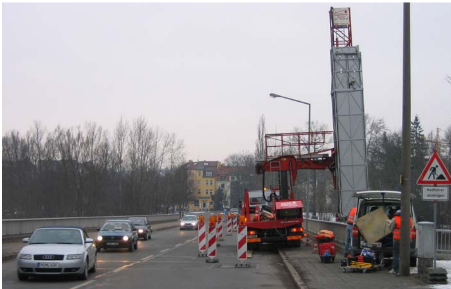
Verkehrssicherung während der Prüfung

Die Potentialfeld- und Betondeckungsmessung wurden in Form von Diagrammen dargestellt.